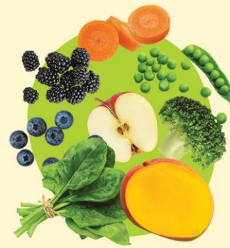
Фрукты и овощи