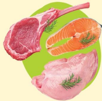
Отборное мясо и рыба